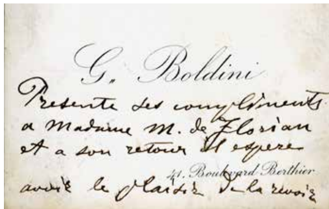
Marthe de Florian de son vrai nom Mathilde Beaugiron.